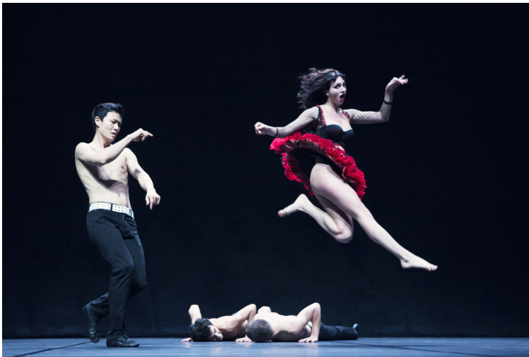
My Ladies Rock

Plus rares, Lizzy Mercier Descloux, punk parisienne, égérie de la scène new-yorkaise, météore disparue en 2004 ; Karen Dalton, la chanteuse préférée de Bob Dylan, entre Billie Holiday pour le chant et Jimmy Reed pour la guitare ; Nico, chanteuse du Velvet Underground à ses débuts, marginale et excentrique, à la voix psalmodiante, nihiliste jusqu'à l'auto-destruction.