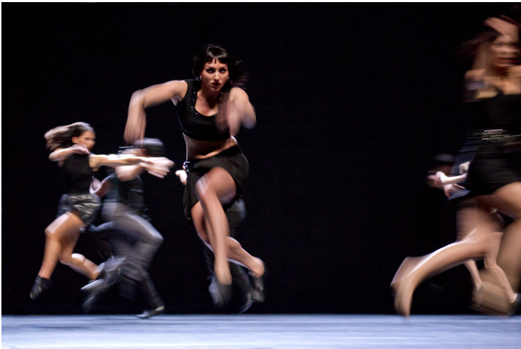
My Ladies Rock