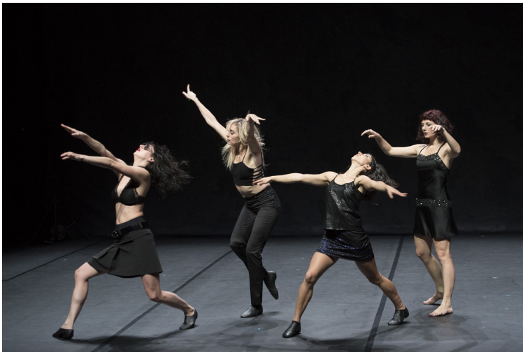
My Ladies Rock