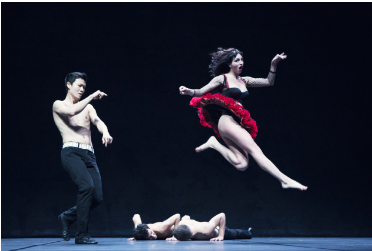
My Ladies Rock