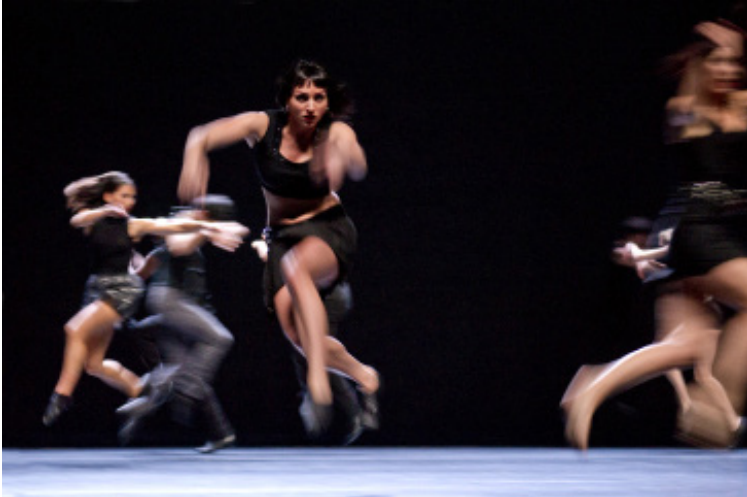
My Ladies Rock