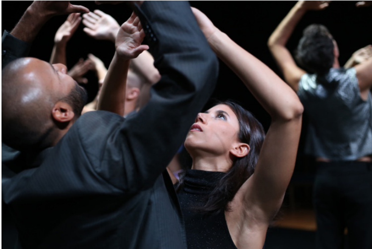
My Ladies Rock

Ainsi, l'histoire du rock serait affaire de mâles. Des concerts boostés à la testostérone, des musiques qui rentrent mal dans des pantalons trop étroit, des destins de héros météoriques. Les femmes n'y seraient que des égéries aux yeux énamourés, des icônes secrètes, ou des muses manipulatrices. Il est vrai que pour faire sauter le verrou de la porte du rock (et empêcher qu'on la referme), les pionnières ont dû oser, et fracasser l'image dans laquelle on voulait les confiner. (Toutes n'y sont pas parvenues, le « man power » en a découragé quelques-unes qui ont dû prendre trop tôt d'autres routes artistiques plus autorisées par l'establishment musical). Les plus offensives se sont donné le droit « d'être des hommes comme les autres », le droit d'être ce qu'elles étaient, jusque dans leurs excès et leur génie musical, jusqu'aux jeux transgenres et jusqu'à la transe.