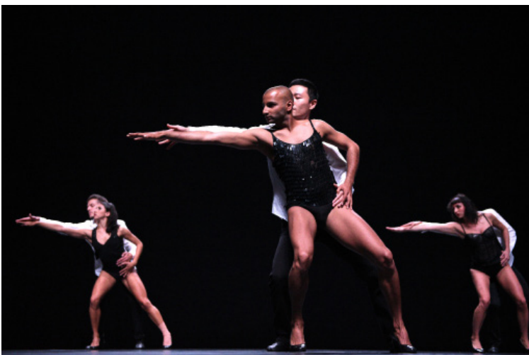
My Ladies Rock