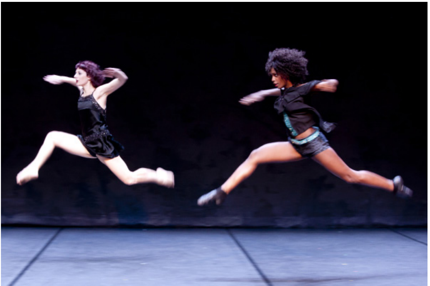
My Ladies Rock