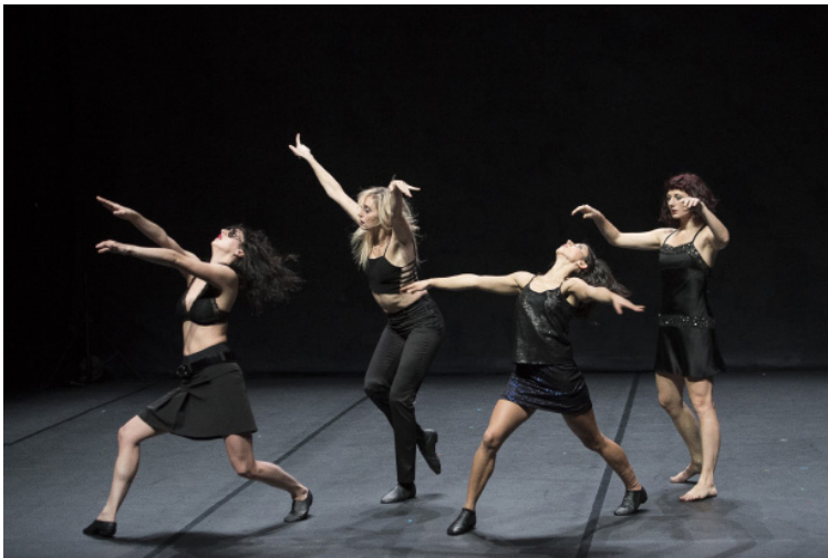
My Ladies Rock

du soul » ; Janis Joplin, qui connaîtra la malédiction des rockers en mourant à 27 ans deux semaines après Jimi Hendrix et neuf mois avant Jim Morrison ; Joan Baez, engagée et tenace, dont la voix pure a accompagné tous les grands combats pacifistes du demi-siècle ; Brenda Lee, enfant prodige du rock, surnommée « Little Miss Dynamite » ; Marianne Faithfull, l'icône sulfureuse au temps des Rolling Stones qui, ayant survécu aux décennies, atteint aujourd'hui la dimension d'un mythe ; Patti Smith, chanteuse et poétesse, amoureuse et provocatrice, littéraire et mystique ; Nina Hagen, dont les outrances post-punk ne doivent pas faire oublier l'apport vocal exceptionnel ; Siouxsie et les Banshees, considérés comme les inventeurs du rock gothique ; enfin, Tina Turner, la panthère, la flamboyante, bien plus qu'une superstar, un symbole de courage et de rage.